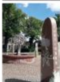
„Plac Zgody”

Urząd Gminy w Kobylance jest otwarty: poniedziałek, wtorek, czwartek, piątek - 7.15 - 15.15, środa - 9.00 - 17.00