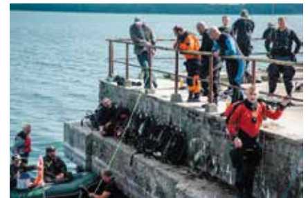
Jedna z akcji poszukiwawczych Strefy Miedwie

Niezwykle cieszy, że dla coraz większej grupy osób torpedownia to nie tylko zatopione kutry i torpedy. To także – a raczej przede wszystkim – ludzie, którzy byli tam niewolniczo wykorzystywani. Po wydobyciu torpedy z jeziora Miedwie do Strefy Miedwie zgłosiła się grupa Wielgowo – Rowerowo z prośbą o pomoc w zorganizowaniu rowerowego rajdu po miejscach