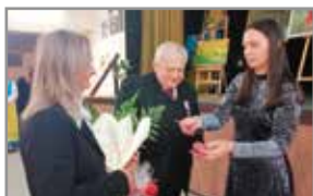
Małżeństwa na medal!