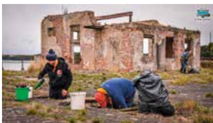
W ramach realizacji projektu Strefa Miedwie – poszukując historii została oczyszczona ze śmieci płyta torpedowni