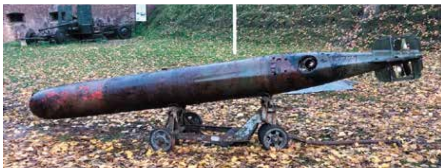
Testowa torpeda lotnicza F5b wydobyta z j. Miedwie w dniu 16 października br.