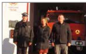
Remont remizy OSP Kobylanka