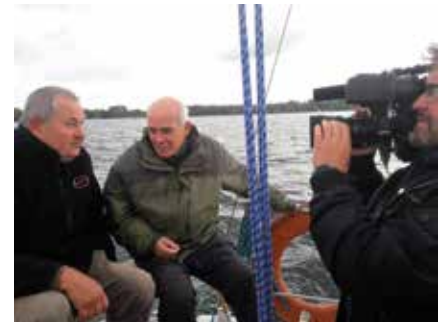
W trakcie akcji poszukiwawczo – wydobywczej torpedy zrealizowany został kolejny odcinek programu TVP Historia „Było ... nie minęło – kronika zwiadowców historii”. Program będzie wyemitowany 9 grudnia br.

pamięci na terenie Gminy Kobylanka. W jedną z październikowych sobót rowerzystów z Wielgowa z historią obozu zapoznał przedstawiciel Strefy Miedwie. O podzielenie się dotychczasowymi odkryciami i ustaleniami z lokalną społecznością poprosili również Strefę Miedwie organizatorzy Biegu Niepodległości w Niedźwiedziu. Planowane jest również zorganizowanie nieodpłatnych warsztatów historyczno-poszukiwawczych w gminnych placówkach edukacyjnych.