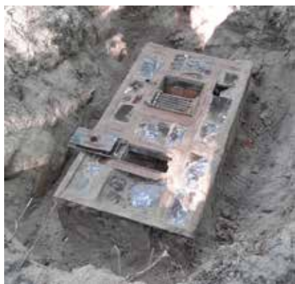
Piec odnaleziony na terenie obozu w Bielkowie

W 2017 r. Gmina Kobylanka zdecydowała o podjęciu prac zmierzających do upamiętnienia pracowników przymusowych i jeńców wojennych z obozów w Bielkowie. Pracownik merytoryczny urzędu przeprowadził kwerendy w szczecińskim oddziale Instytutu Pamięci Narodowej, w Archiwum Państwowym w Szczecinie oraz w Wojskowym Biurze Historycznym w Warszawie. Rozmawiał także z mieszkańcami Bielkowa, którzy