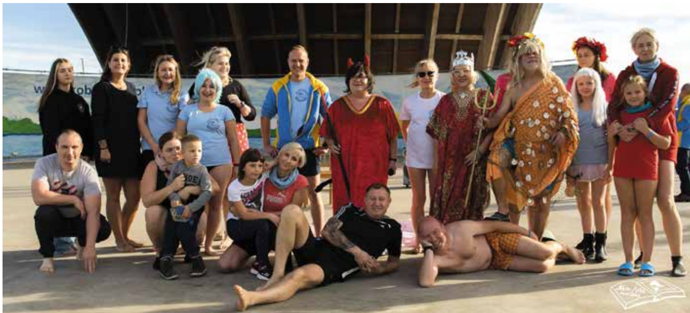
fol. Show Foto

2 października w Amfiteatrze w Morzyczynie SKM „Miedwianie” zainaugurował kolejny sezon morsowy. Amatorów zimnych kąpieeli nie brakowało, a do klubu przystąpiło kolejnych 16 osób, które zostały pasowane na morsów. Oczywiście nie mogło także zabraknąć dobrej zabawy i wspianiałych strojów.