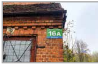
Nie będzie przebudowy świetlicy w Kunowie str.9