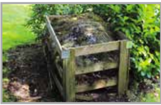
Kontrola przydomowych kompostowników str. 16