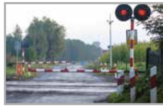
Przejazd kolejowy w Miedwiecku czasowo zamknięty str. 19