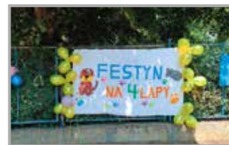
Festyn na 4 Łapy str. 9