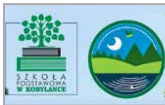
Projekt „Miedwie Lake as a source of life” str. 6