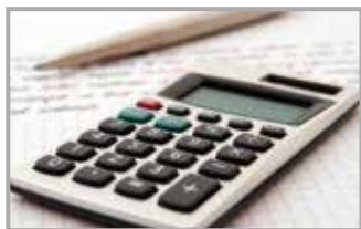
Podsumowanie realizacji zadań w ramach funduszy sołeckich w roku 2022 str. 4-5