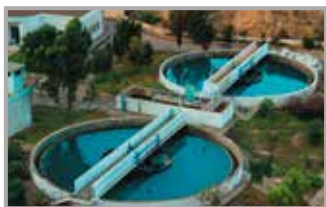
Szamba i przydomowe oczyszczalnie ścieków do kontroli str. 12-13